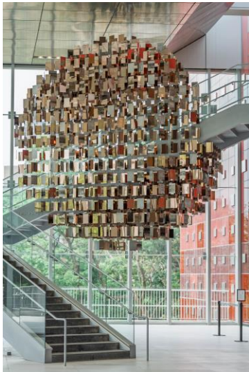
國家檔案館「以史為鏡」公共藝術照

請至檔案局全球資訊網/認識我們/局館簡介/本館簡介/場域介紹，查看相關資訊。( https://www.archives.gov.tw/tw/arctw/699.html )