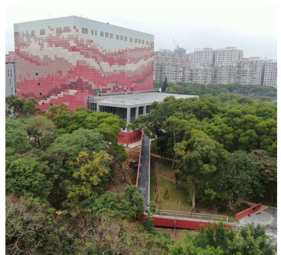
國家檔案館外觀實景圖 2