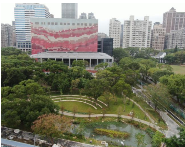
國家檔案館外觀實景圖 1