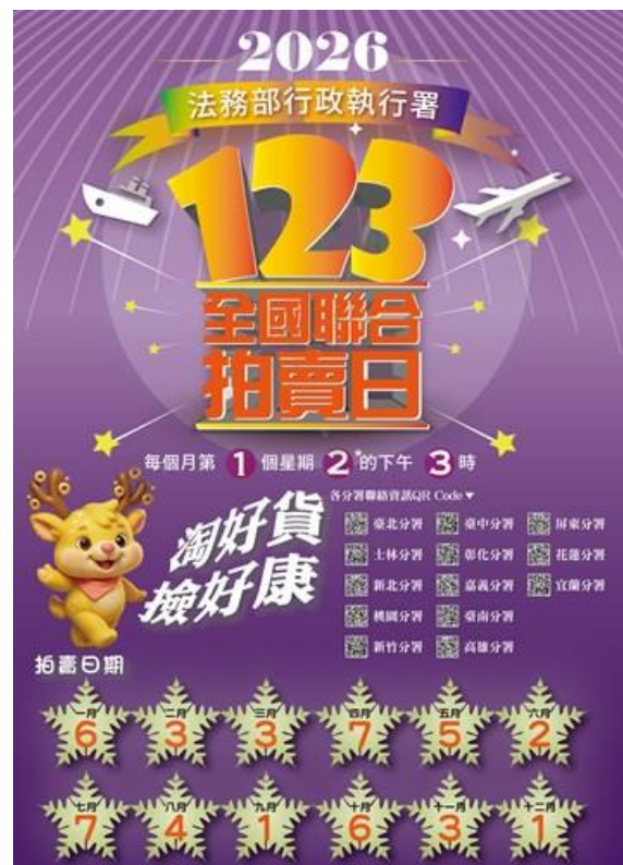
圖 2:115 年 123 聯合拍賣海報