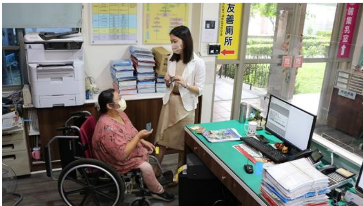
楊分署長（右1）適時關心同仁工作狀況，打氣給予鼓勵並改善職場辦公環境