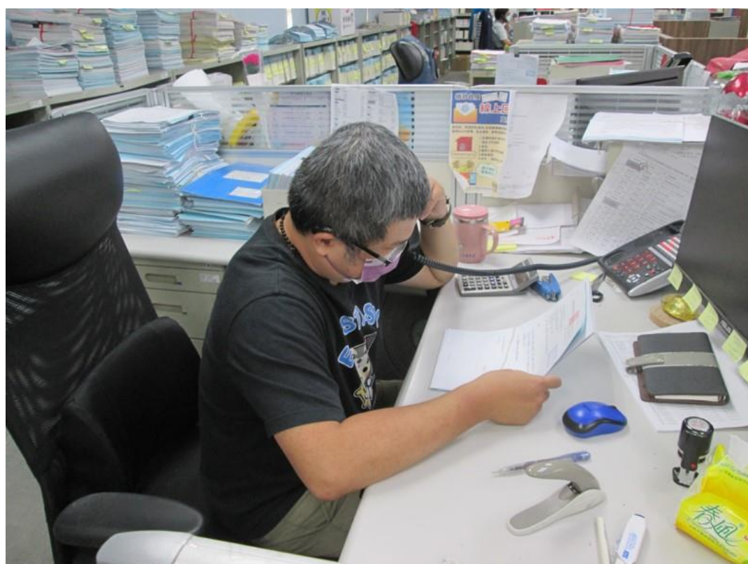
分署採購的數位電話可擴大音量功率，減輕耳朵不方便同仁工作時的負擔