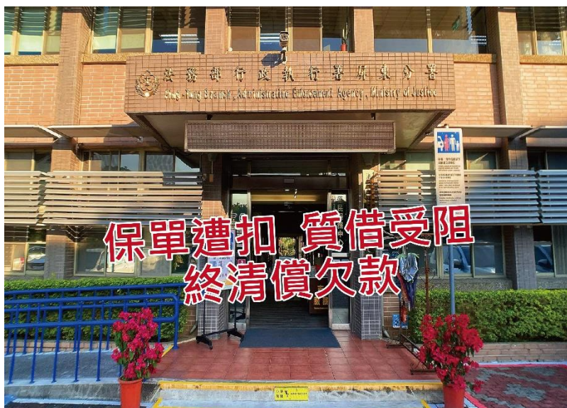
屏東執行分署追回陳年罰單與欠款