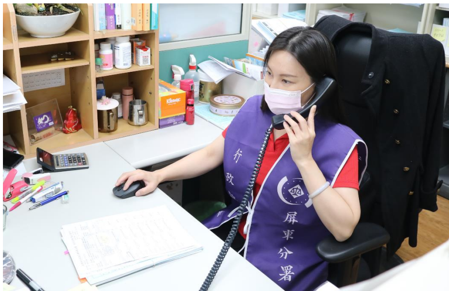
屏東執行分署執行人員接到義務人來電詢問無法保單借款乙事，示意圖