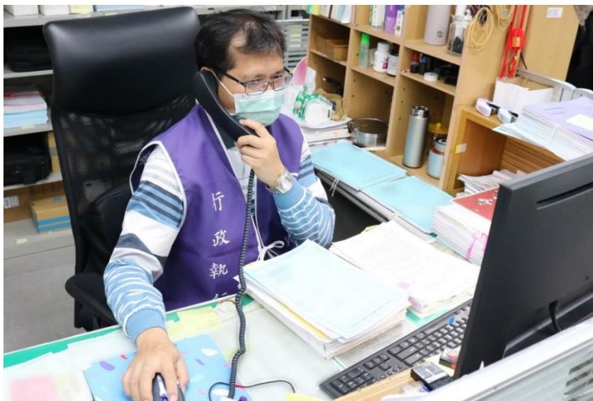
書記官與監所管理員聯繫確認義務人是否已奔喪等相關事宜，示意圖