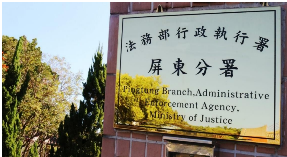
屏東執行分署調查後撤銷扣押命令讓義務人為母親盡最後孝道