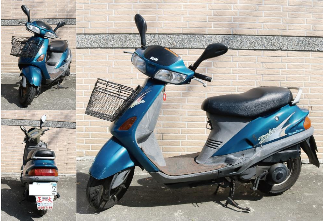
義務人攜帶豬肉月餅入境被罰 20 萬元，屏東分署法拍義務人機車