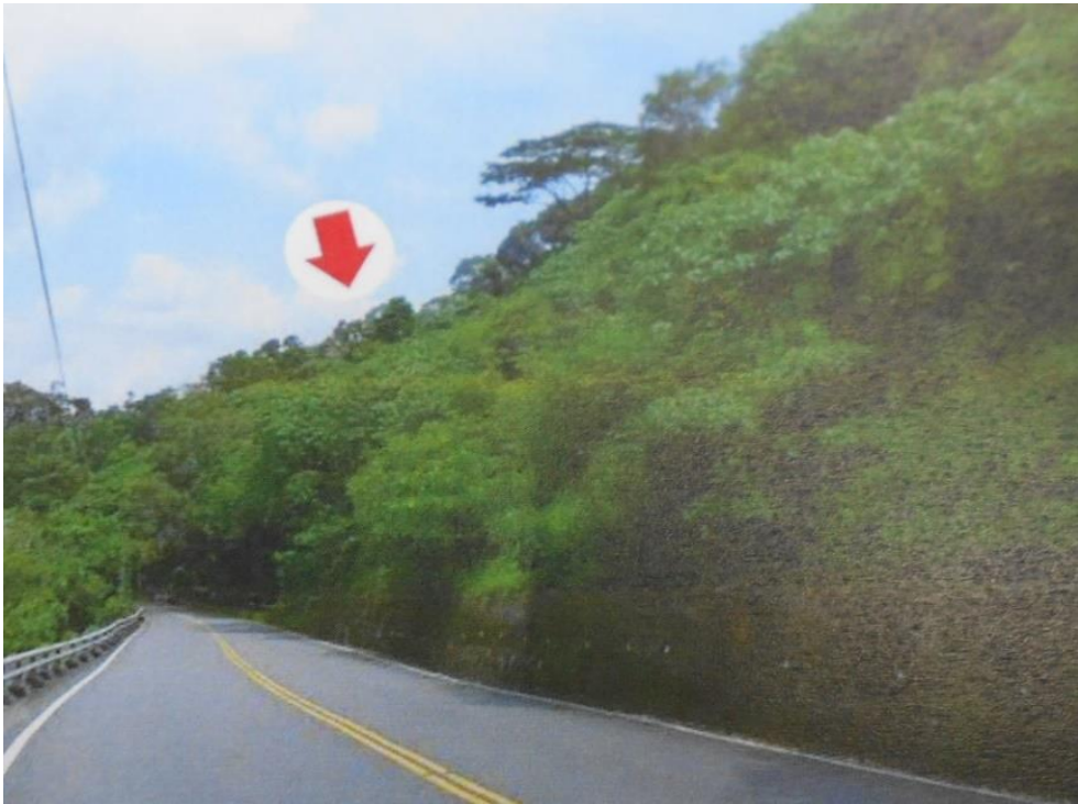
屏東執行分署 112 年 3 月 7 日法拍座落三地門的原住民保留地