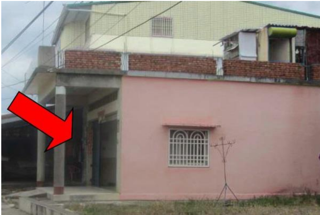
屏東執行分署 112 年 3 月 7 日法拍枋山透天厝持分，房屋經變色處理