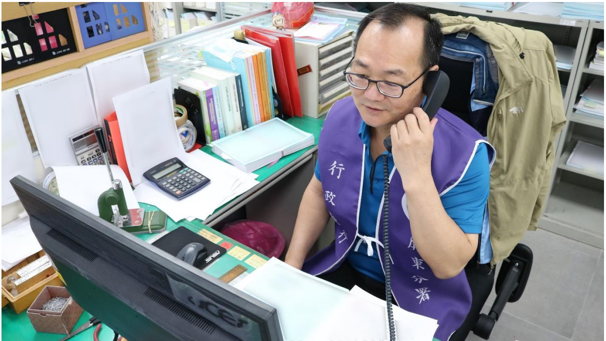
書記官接到酒駕義務人來電希望分署趕快去扣押他的存款，示意圖