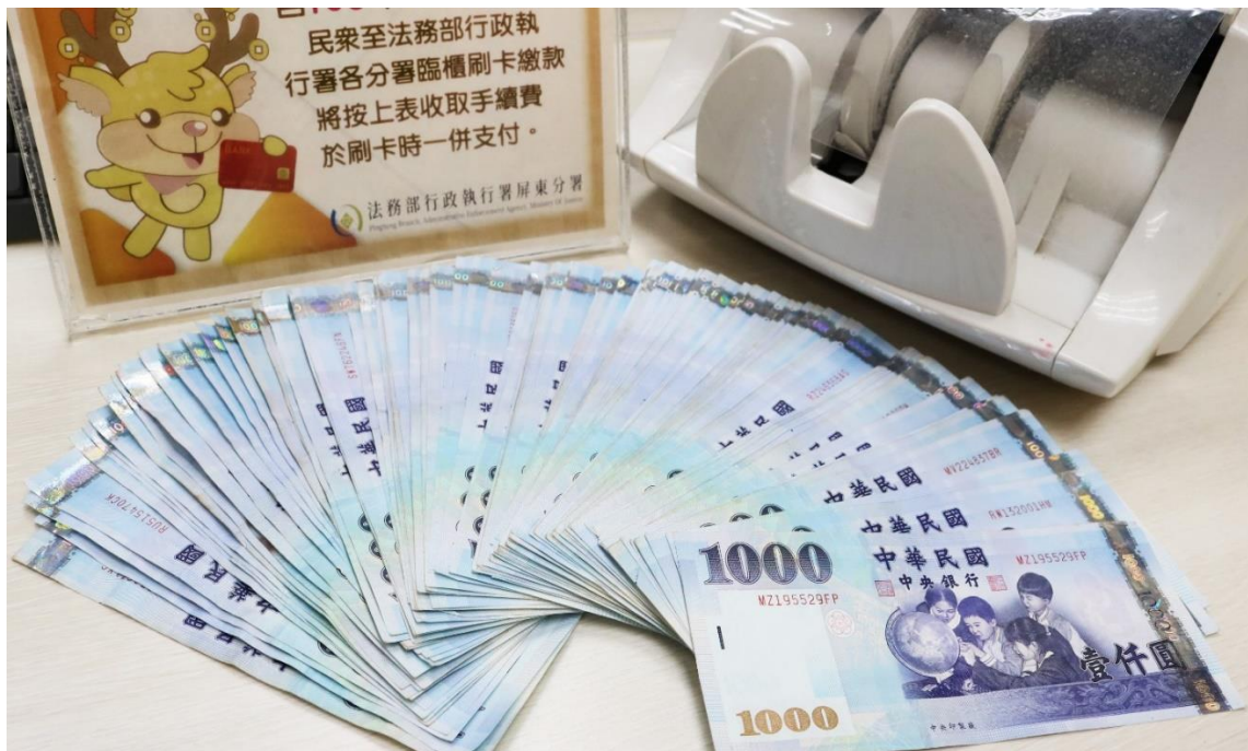
分署查封土地後，義務人帶著 30 萬元現金到分署繳清罰單